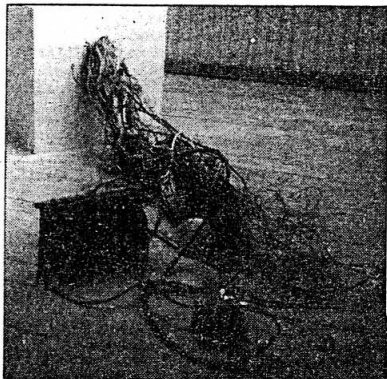
Jitka Malovaná našla materiál pro své dílo na šrotovišti